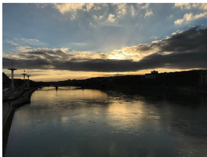
里昂 Rhone River

最後，分享在法國的兩個心態以及一個原則，心態上保持開放接受，在法國很多事都很不可思議，有時候只能笑笑得面對；在接受的同時，也不要忘記保有據理力爭的心態，很多事情都是溝通(吵架)出來的，當你認為你的權益受到侵害的時候，請一定要據理力爭。而一個原則是，凡事小心。出國在外，安全、財務是最重要的，尤其是在法國，千萬要小心財務與自身安全，才能快樂的體驗法國生活。