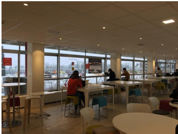
EM Lyon Cafeteria