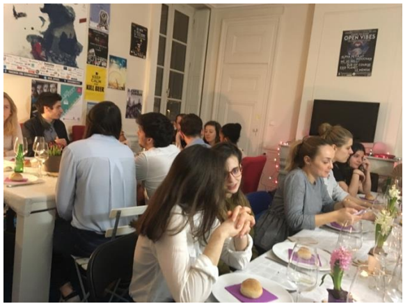
美食社美酒社聯合晚餐