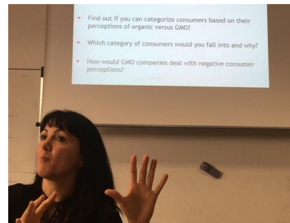
Consumer Behavior 上課