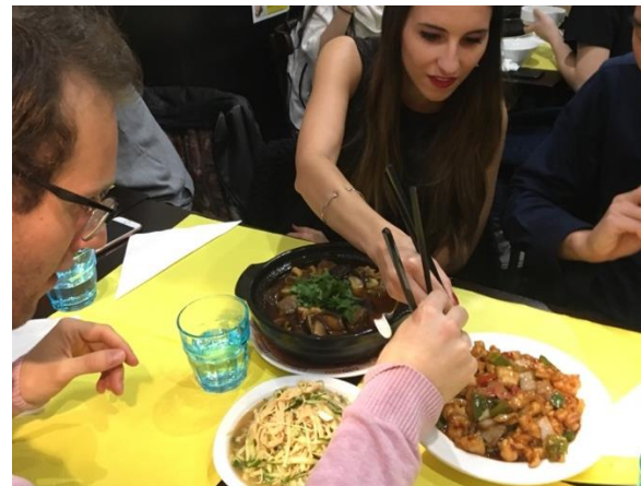
帶朋友到中餐廳用餐