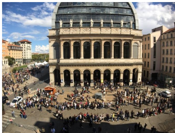
歌劇院與里昂市中心