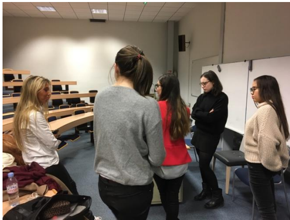
Consumer Behavior 分組報告前的練習