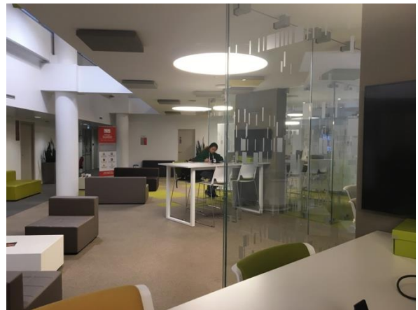
EM Lyon Learning Hub