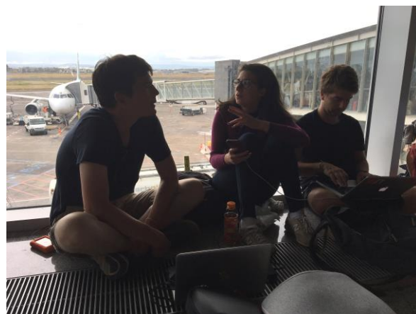
Service Experience 在機場和老師討論