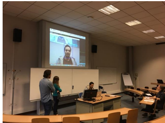
AI 課同學的專案報告