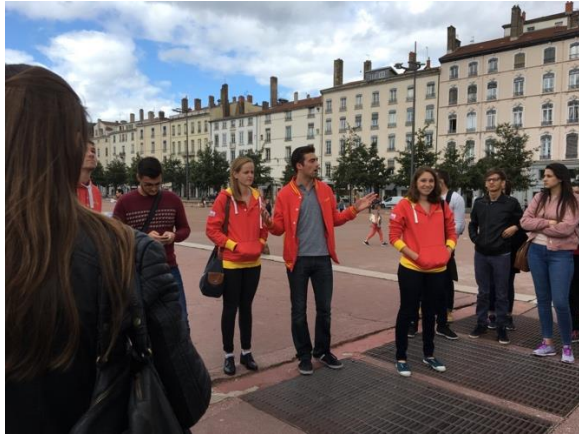
BDI Lyon Visit 活動