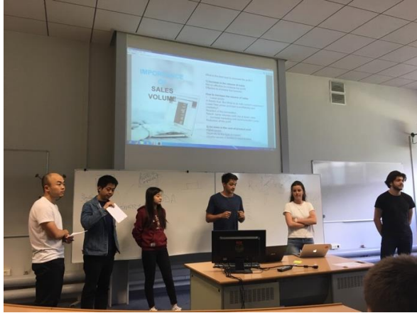
Global Purchasing 上課