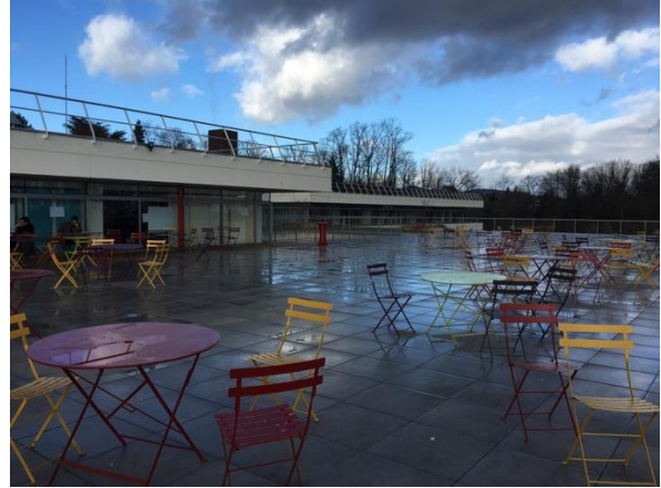
EM Lyon 校園戶外平台