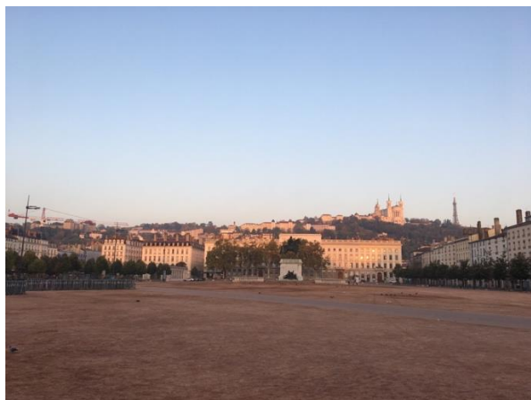
Bellecour 廣場與後方山上的聖母教堂

每年里昂最盛大的活動要算是里昂燈光節（Fête des Lumières），在十二月初舉行，持續三天，各大建築及景點會有不同的燈光藝術裝置，例如主教座堂、市政廳、高盧羅馬古劇場都有投影燈光秀，聖十字山的街道或 Bellecour 廣場有小型藝術裝置，整個城市非常熱鬧，住在里昂千萬不要錯過。