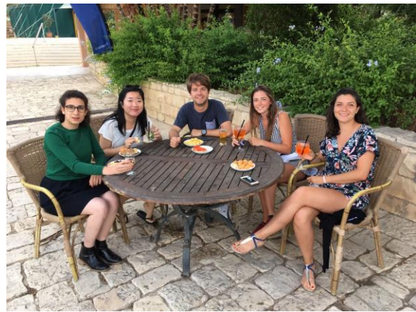
Service Experience 每日會議