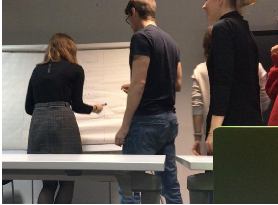
Deciding 課的 Tipping Point 實驗