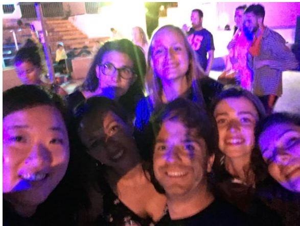
Service Experience 參加 Club Med 活動