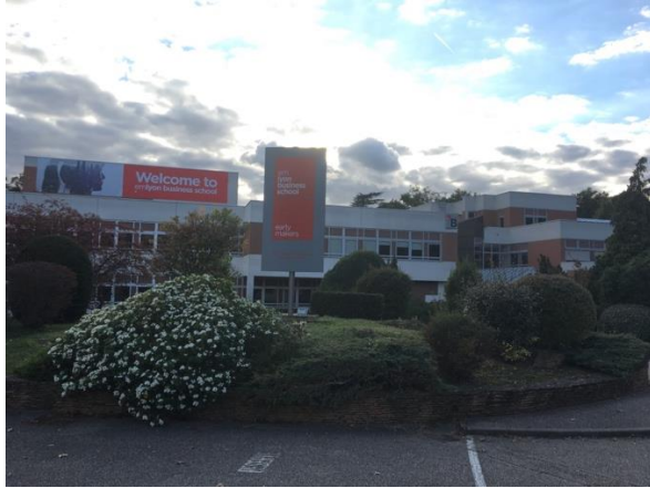
EM Lyon 校園