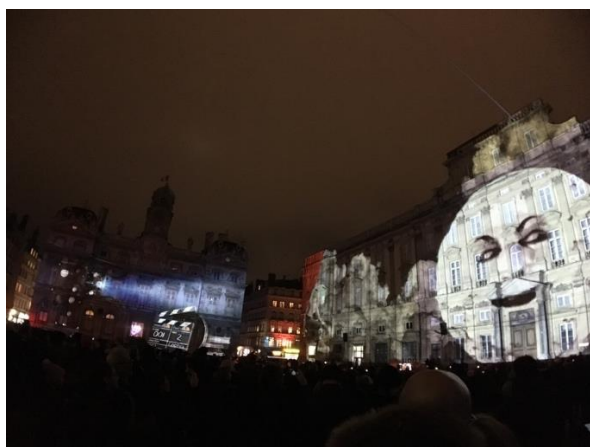
里昂燈光節市政廳的燈光投影秀